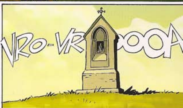
1925. Aux environs du village de Hesslingen, en Basse-Saxe